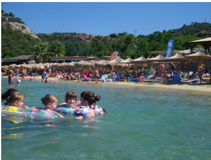
Εικ.1 Ομαδικά παιχνίδια άσκησης

Ακολουθούν, παραδείγματα συγγραφής τίτλων, αρίθμησης και θέσης, εικόνων, σχημάτων και πινάκων.